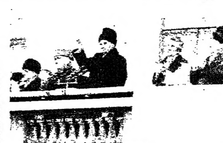
تشاوتيسكو يلوح للجماهير (روماني)

وحدثت تسس، ان الزعيم الروماني نيكولاي تشاوتيسكو الذي قبل ذلك خطبا في سلطة الجمهورية، واكدت وكالة تسس، ان تشاوتيسكو في الشوارع وكثرت مواجهات في عدد من شوارع وسط المدينة.